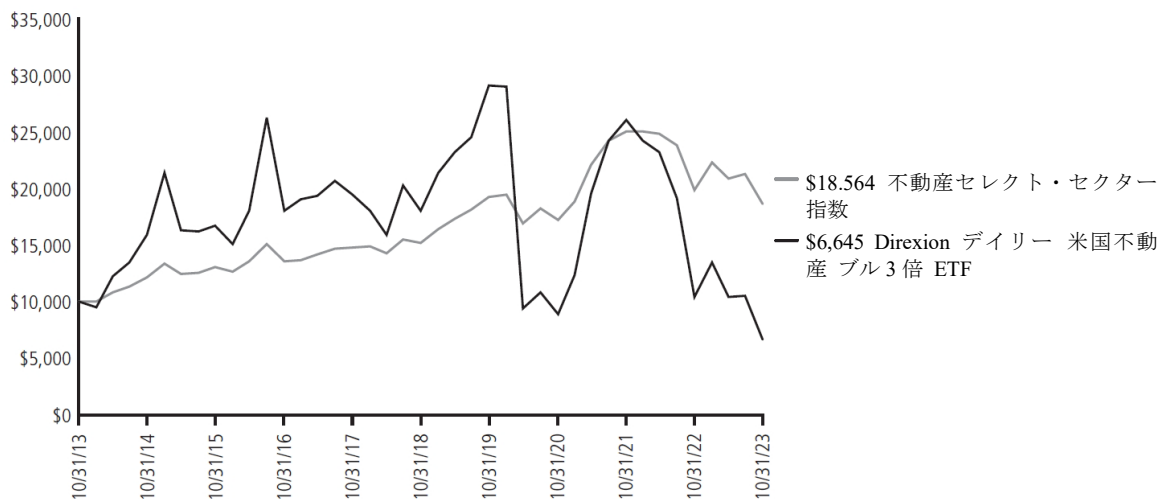
2023年10月31日時点の年率平均トータルリターン