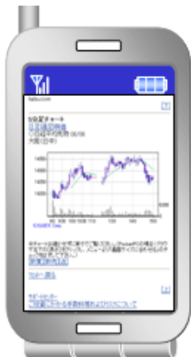
<先物の5分足チャート>