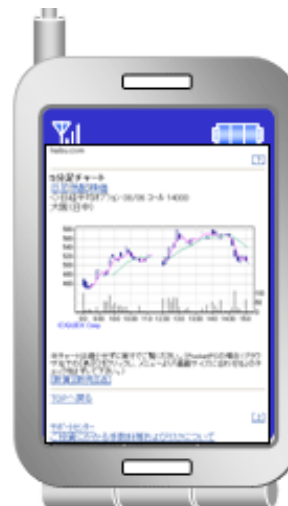
<オプションの5分足チャート>